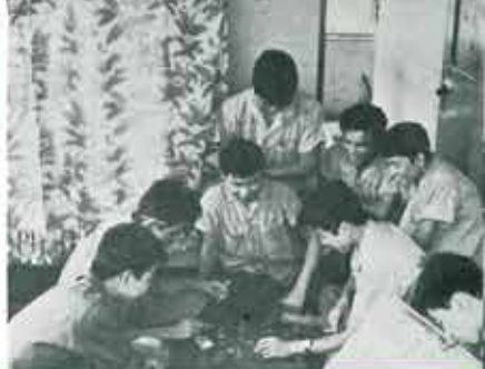
⑥ 休憩室 (3階)