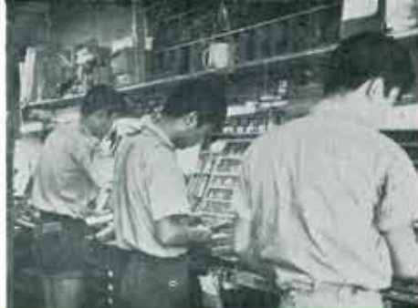
② もよこじ(横約室) (階別館)