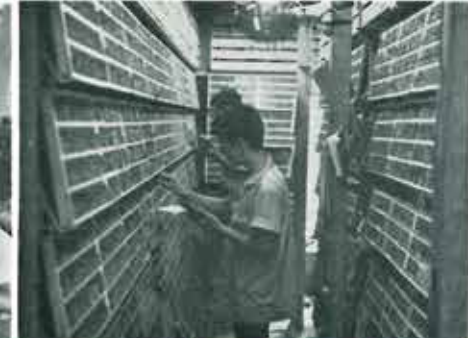
① ぶんせき(文撰)室 (1階別館)