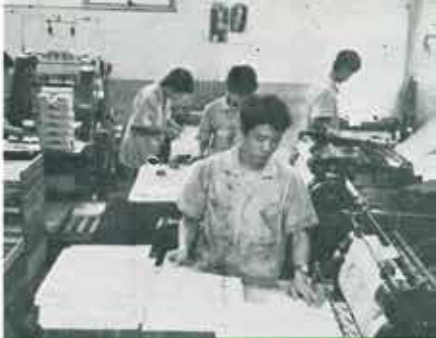
③ 印刷機械室 (1階)